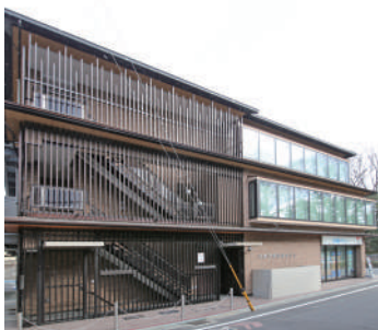
近畿予備校烏丸ビル(外観)

宅建試験初学者&経験者、不動産業者のための パーフェクト宅建士講座! オンラインでも受講できる!仕事とも両立して勉強も進められる!!