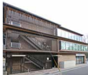
近畿予備校烏丸ビル(外観)