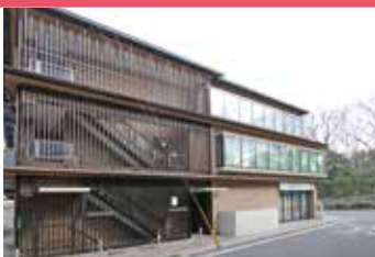
近畿予備校烏丸ビル(外観)