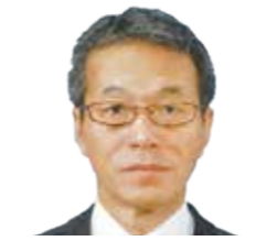
信吉登記測量事務所 所長(土地家屋調査士)

不動産登記、商業登記をはじめ、司法書士業務全般について、業務別にわかりやすく説明します。また、実際の不動産登記、商業登記等の業務事例に限らず、成年後見制度や、遺言、家族信託など生前の財産管理制度、亡くなった後の相続問題についても講義を行います。