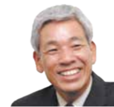
株式会社八清(ハチセ) 取締役会長

建築の構法の概要から建築コスト見積、工事の流れと工程管理、建築工事の式典等についても、実務(現場)の視点から説明(講義)します。また、「躯体工事中の工事現場」と「完成間近い工事現場」を解説を交えて見学していただきます。