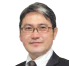
大和不動産鑑定(株) 京都支社鑑定部長(不動産鑑定士)

1年間の講義で、まずは、鑑定評価の理論(基礎)全体を体系的に理解し習得して頂きたい。また、実際の鑑定評価書を題材に講義をしますので、鑑定評価の実務の基礎についても学んで頂きます。さらに、鑑定評価書の読み方(勘どころ等)・活用方法等についても説明(講義)しますので、理解して実践力も付けてもらえればと思っております。