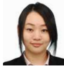
税理士法人 川嶋総合会計 (税理士)