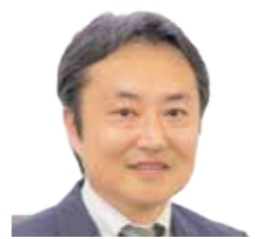
司法書士法人 渡辺総合事務所 代表(司法書士)

不動産の取引(仲介)業務の流れ(例示:売り・買い情報の取得→売り物件・買い希望の受付→物件調査→営業活動→契約書(物件説明書)作成→契約締結→物件引渡し)に沿って、業務内容と注意点を解説します。不動産取引業務において良く問題(トラブル)になる事例も出来るだけ多く解説したいと思います。実務的な講義のほかに、私の40数年に及び業務経験等もお話しできればと思っております。