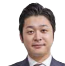
弁護士法人 梅ヶ枝中央法律事務所 (弁護士)

特に、本講義では、紛争前の対応及び紛争後の対応を横断的に取り扱うことで、有事の際を見据えた実務的な対応とは何かをお伝えできればと考えております。