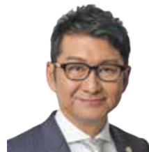
弁護士法人 梅ヶ枝中央法律事務所 代表社員(弁護士)