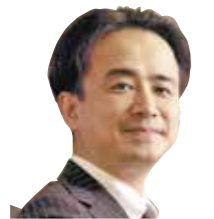
(株)ローバー都市建築事務所 代表取締役(一級建築士)

1年間の講義で、まずは、テキストに基づき建築全体の基礎知識を体系的に理解し習得して頂きたい。次に、各種の建築事例を題材にその特徴等について解説(講義)したいと思います。また、現地で実際に建物を観察して理解を深める研修も出来ればと考えています。