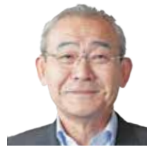
税理士法人 川嶋総合会計 代表社員(税理士)

不動産の基本的な税務知識だけでなく、経営支援・相続支援対策等を含めた幅広い分野をわかりやすく解説します。受講生の皆様が、実際の場面で役立つ講習会にしていきたいと思っておりますので、積極的なご意見、ご質問をお願いします。