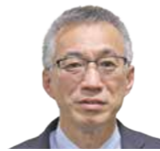
要建設(株) 代表取締役社長