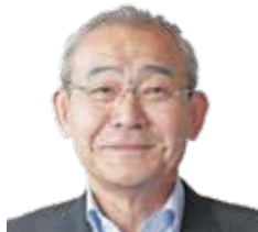
税理士法人 川嶋総合会計 代表社員(税理士)

特に、本講義では、紛争前の対応及び紛争後の対応を横断的に取り扱うことで、有事の際を見据えた実務的な対応とは何かをお伝えできればと考えております。