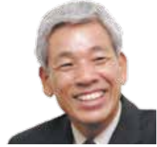
株式会社八清(ハチセ) 取締役会長

担当講義では、紛争処理の解決機関について紹介します。また、どのような建築紛争が多いかやその特質を解説します。なぜ建築に纏わる紛争が多く発生するのか、要因や原因を一緒に考えていただきます。紛争解決の現場で経験した実例を紹介しながら、紛争の概要に基づきどのように解決したか解説します。最後に紛争に巻き込まれないためには、何にどのように注意すればよいのかを一緒に勉強したいと思います。