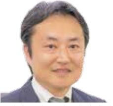
司法書士法人 渡辺総合事務所 代表(司法書士)

不動産の取引(仲介)業務の流れ(例示:売り・買い情報の取得→売り物件・買い希望の受付→物件調査→営業活動→契約書(物件説明書)作成→契約締結→物件引渡し)に沿って、業務内容と注意点を解説します。不動産取引業務において良く問題(トラブル)になる事例も出来るだけ多く解説したいと思います。実務的な講義のほかに、私の40数年に及ぶ業務経験等もお話しできればと思っております。