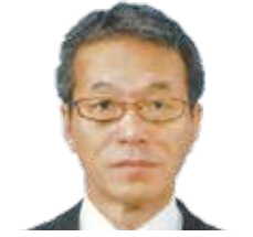
信吉登記測量事務所 所長(土地家屋調査士)

不動産登記、商業登記をはじめ、司法書士業務全般について、業務別に分かりやすく説明します。また、実際の不動産登記、商業登記等の業務事例に限らず、成年後見制度や、遺言、家族信託など生前の財産管理制度、亡くなった後の相続問題についても講義を行います。