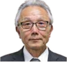
要建設株式会社 顧問(一級建築士)

また、「躯体工事中の工事現場」と「完成間近い工事現場」を解説を交えて見学していただきます。