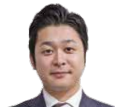
弁護士法人 梅ヶ枝中央法律事務所 (弁護士)

1年間の講義で、不動産に関連する法律知識全般を体系的に学び習得して頂くことが、本講座の主眼です。また、実際の不動産関連事件を題材にした講義により、不動産事件(問題)に対する法律面からの理解と対応力も付けて頂ければと思います。