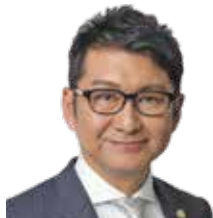
弁護士法人 梅ヶ枝中央法律事務所 代表社員(弁護士)