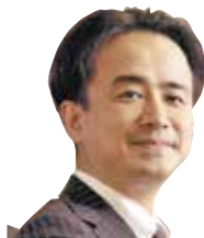
(株)ローバー都市建築事務所 代表取締役(一級建築士)

不動産の売買、貸借、相続等において必要となる基本的な税務知識をいろいろな事例を含めて、分かりやすく解説します。受講生の皆様からのご意見、ご質問については、丁寧にお応えしていきたいと思っております。