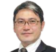
大和不動産鑑定(株) 京都支社鑑定部長(不動産鑑定士)

不動産登記情報の有効活用で、顧客満足度向上ができるようなお話しをします。境界(筆界)問題、所有権不明等の管理不全不動産問題等について、傾向と対策をお話しします。これからの不動産取引の実務で使える、価値ある情報をお話しします。