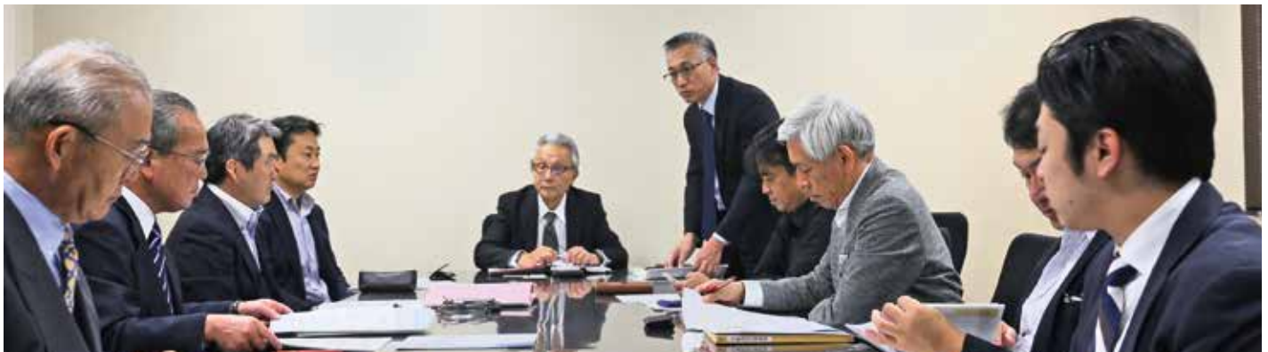
講師陣によるカリキュラム検討会