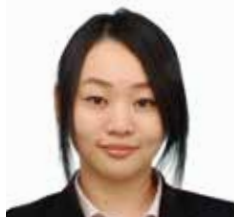
税理士法人 川嶋総合会計 (税理士)

不動産の基本的な税務知識だけでなく、経営支援・相続支援対策等を含めた幅広い分野を分かりやすく解説します。受講生の皆様が、実際の場面で役立つ講習会にしていきたいと思っておりますので、積極的なご意見、ご質問をお願いします。