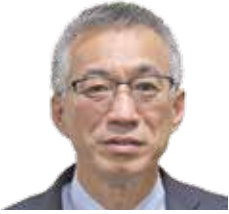
要建設(株) 代表取締役社長(一級建築士)